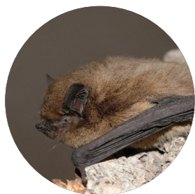
Pipistrelle de Nathusius ( Pipistrellus nathusii )