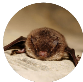
Murin de Daubenton ( Myotis daubentonii )