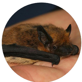
Pipistrelle de Kuhl ( Pipistrellus kuhlii )