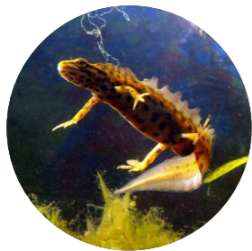
Triton ponctué ( Lissotriton vulgaris )