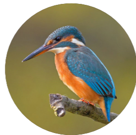
Martin-pêcheur d'Europe ( Alcedo atthis )