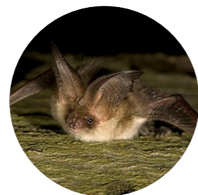
Oreillard gris ( Plecotus austriacus )