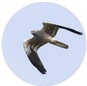
Busard cendré ( Circus pygargus )