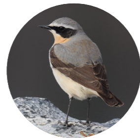
Traquet motteux ( Oenanthe oenanthe )