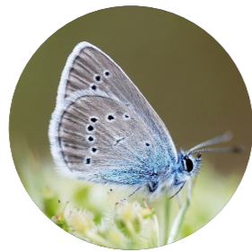
Demi-argus ( Cyaniris semiargus )