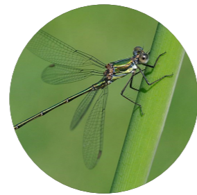
Leste verte ( Chalcolestes viridis )