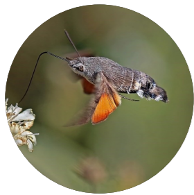
Moro-spinx ( Macroglossum stellatarum )