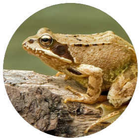
Grenouille rousse ( Rana temporaria )