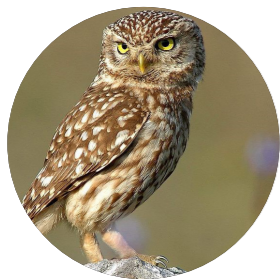
Chevêche d'Athéna ( Athene noctua )